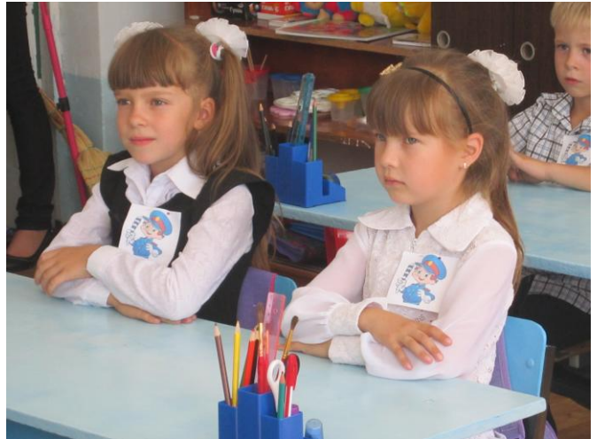
Принятие первоклассников в пешеходы.