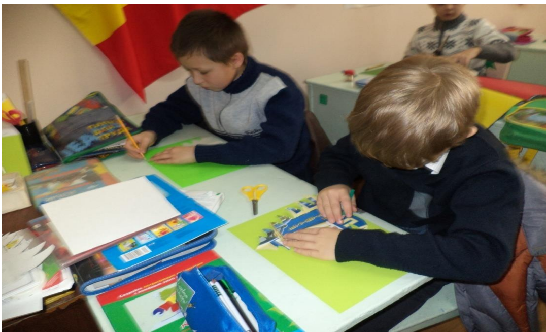
❖ Вырезаем ёлочки и складываем их тоже пополам