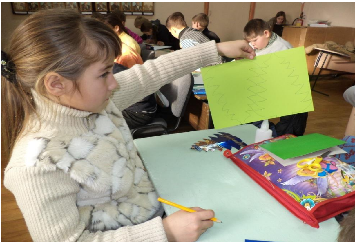
❖ Складываем картон пополам